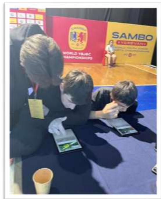
“Play True” Quiz at World Youth Junior Cadets Sambo Championship «Մրցիր ազնիվ» հարցաշարը սամբոյի պատանիների պատանի կադետների աշխարհի առաջնությունում